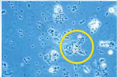
▶ 대장균이 디아쿠어® 플러스의 섬유질에 흡착된 모습

디아쿠어 플러스 1회 용량으로 약 3,500억 E.Coil을 흡착 제거할 수 있습니다.