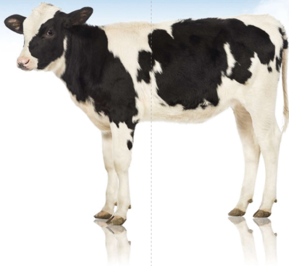
천연 섬유질과 전해질 합제로 송아지 장 건강 개선